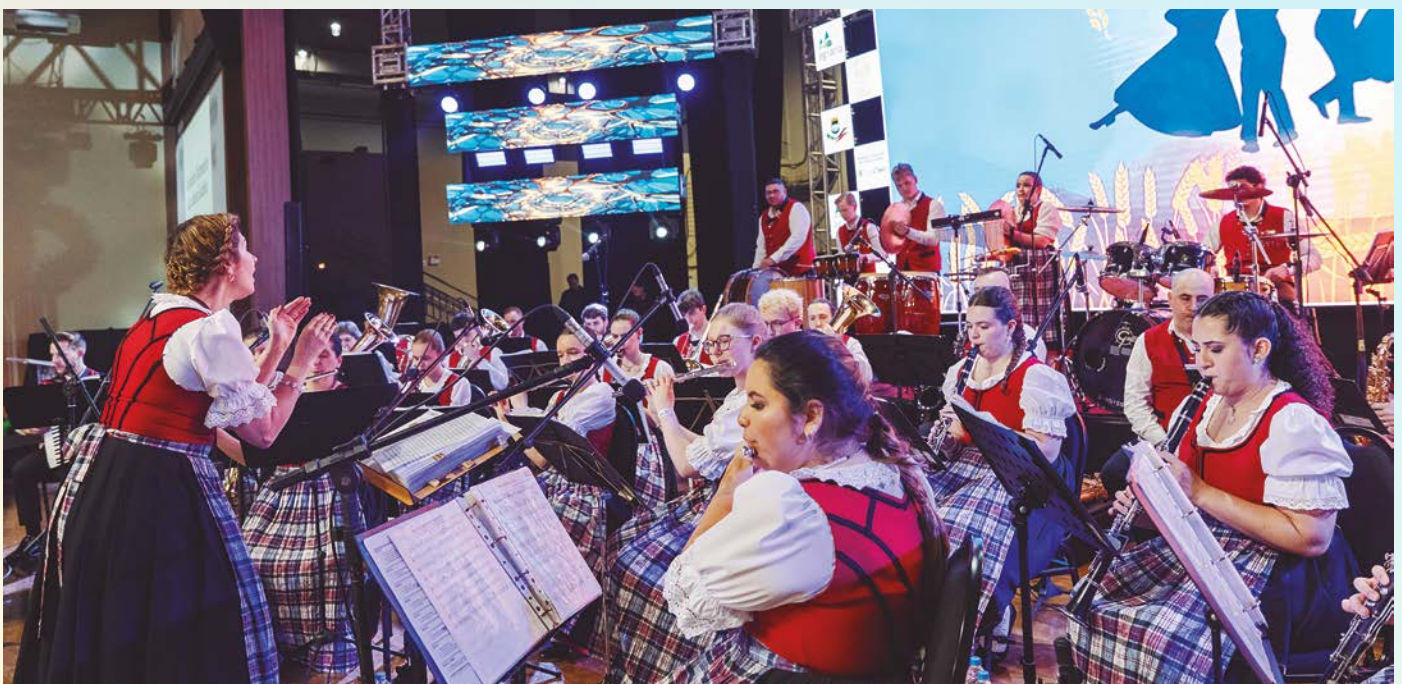
As apresentações revelaram a riqueza cultural dos suábios do Danúbio por meio da música, do canto, da dança e do teatro.