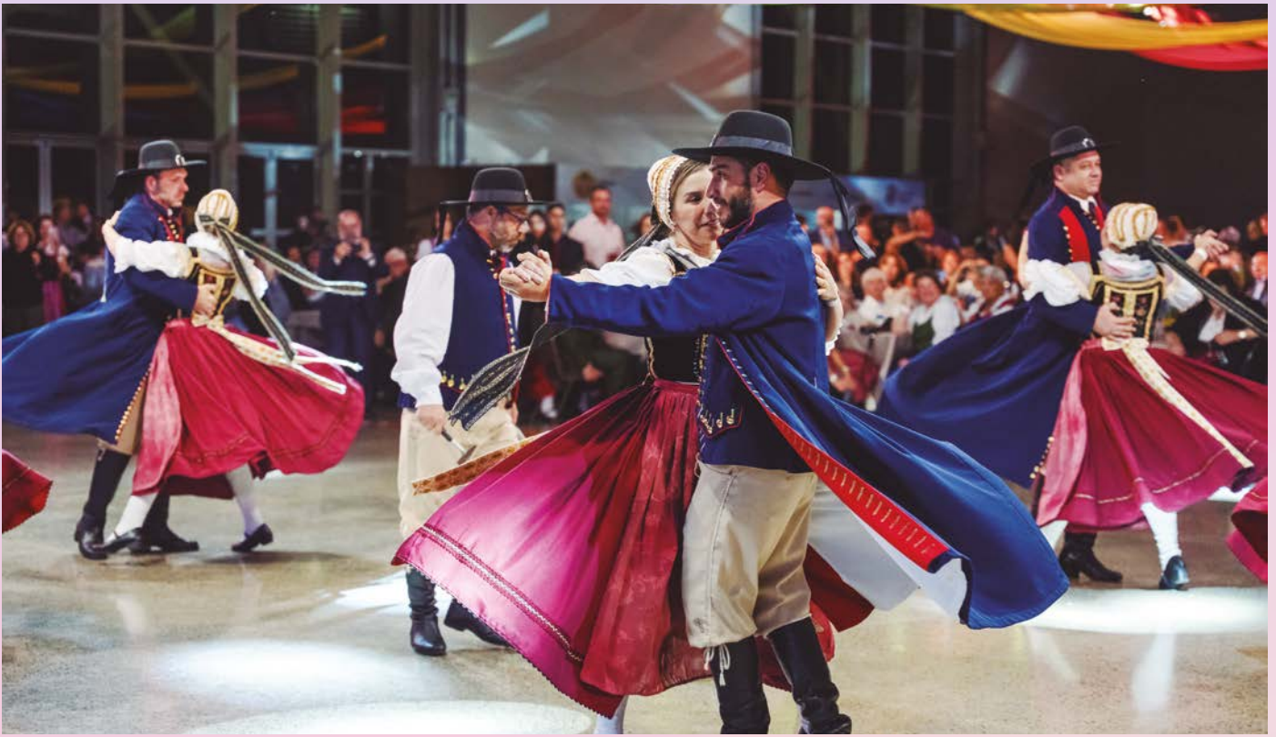
O programa foi complementado por outros grupos de dança e música, incluindo o Grupo de Danças Folclóricas Weißer Schwan, de Rolândia (PR).

a Banda Original celebrou, neste ano, seus 40 anos, um momento repleto de orgulho, história e laços musicais.