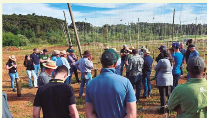
Participantes do 1º Dia de Campo de Lúpulo