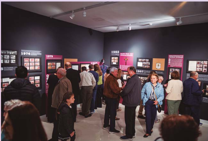
Abertura da nova exposição temporária do Museu Histórico de Entre Rios, sob o tema “Ser ou não ser: teatro e identidade suábica”.