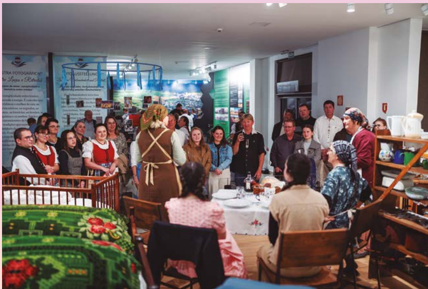
Grupos teatrais infantil, juvenil e adulto ofereceram um retrato vivo da história do teatro local.

Como de costume, no dia 17 de outubro, grande parte do público retornou para uma inesquecível celebração da tradição suábica. O Programa Cultural tornou-se uma narrativa viva da comunidade, em que o símbolo da mala ganhou um novo significado. No centro dessa experiência, 18 grupos culturais, com 266 participantes, criaram uma atmosfera cheia de emoção, identidade e sentido de pertencimento.