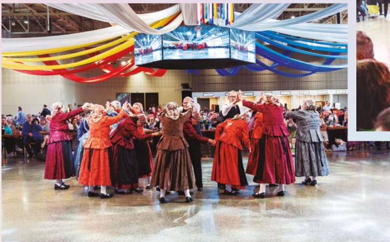
A apresentação do Grupo de Dança Sênior durante o almoço lembrou as gerações que transmitiram esse legado cultural.