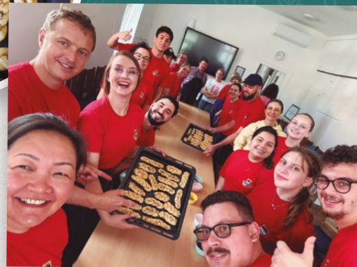
Integrantes do Grupo de Danças Adulto e do Grupo Amizade fazendo o Flézl durante sua passagem por Werischwar, na Hungria