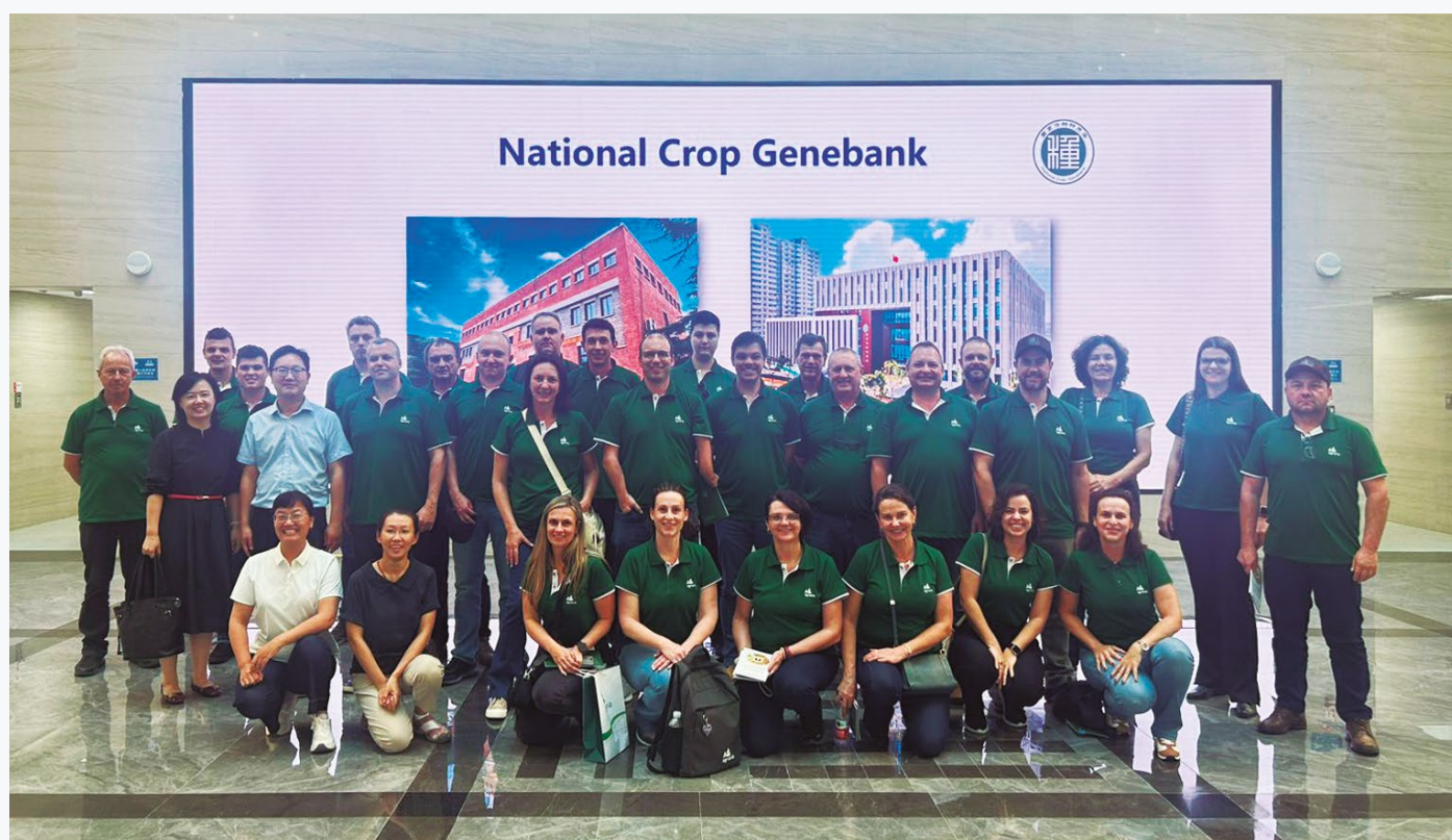
No roteiro estavam a capital administrativa Pequim e Xangai, o centro econômico da China.

queda no número de nascimentos no país fez com que fosse revogada a política do filho único, que durou de 1979 a 2005. Também foram instituídos incentivos para que as famílias tenham mais de um filho. Entretanto, a maioria dos casais chineses se habituou a ter apenas uma criança, já que assim têm melhores condições financeiras para investir na educação de seus herdeiros. Muitos jovens casais, inclusive, optam por não ter filhos. “A China sempre vai ser um país populoso, mas, essa queda nos nascimentos nos indica que a economia do país não irá crescer de forma tão expressiva como nas últimas décadas. Claro, eles vão continuar importando commodities, mas esses volumes não devem aumentar tanto. Uma boa oportunidade para o agronegócio brasileiro é investir em produtos já acabados, que têm um valor agregado de comercialização maior”, analisa Eric Martins.