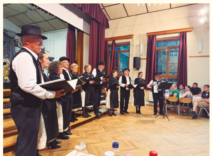
As apresentações em Városlőd também mostraram de forma impressionante como os suábios estão fortemente unidos.