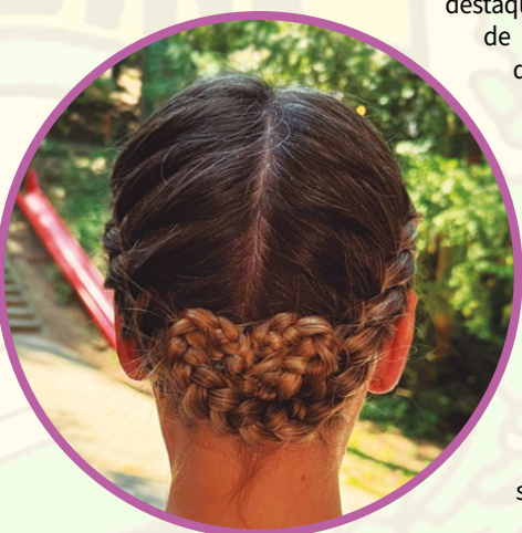
Trança feita para o casamento suábio encenado.

Após uma oficina de dança na manhã seguinte, o grupo viajou para Magyarpolány, onde viveu o último grande destaque da viagem: uma encenação de um casamento suábio. Já ao descer do ônibus, foram recebidos pelos sons de uma banda juvenil de metais. Toda a comunidade colaborou, e a mesa do casamento, fartamente servida, foi preparada com muito carinho. Na igreja barroca, o padre abençoou o “casal de noivos”, enquanto o coro cantava a “Ave-Maria”. Em seguida, a celebração prosseguiu animadamente no salão comunitário.