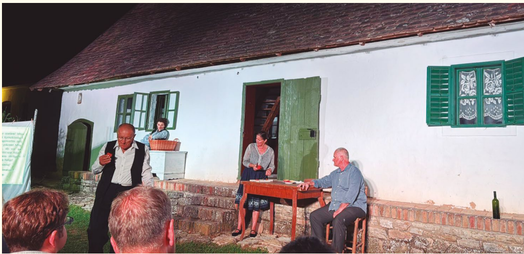
Em Szederkény, um teatro ao ar livre emocionou profundamente o grupo.