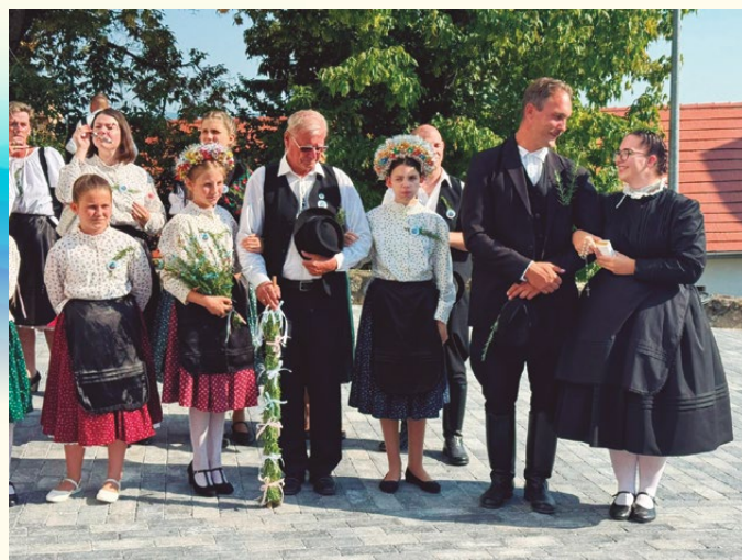
Casamento suábio perfeitamente encenado em Magyarpolány.