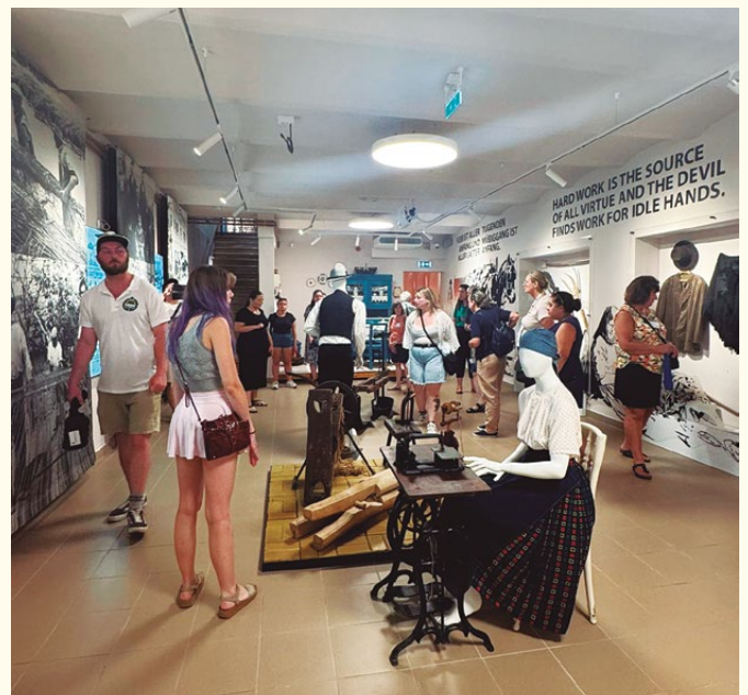
Em Sombor, o Museu Suábio, a prefeitura histórica e as palestras da associação St. Gerhard tornaram o dia inesquecível.