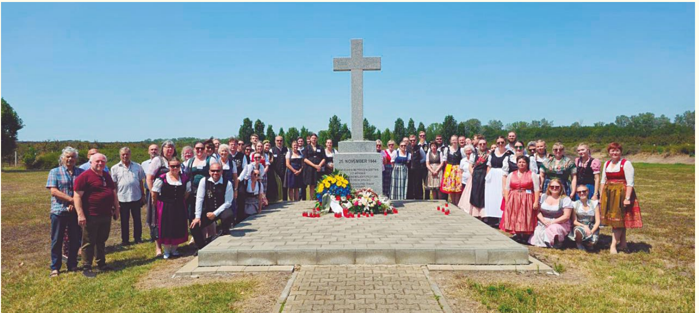
Também em Filipowa, os viajantes depositaram coroas no memorial com silenciosa reverência.