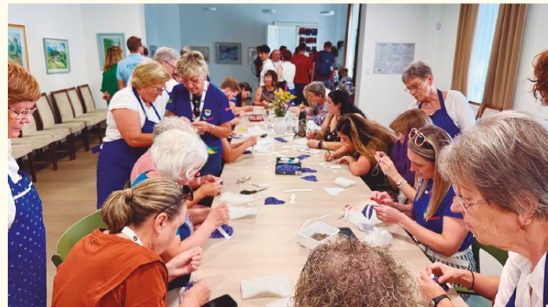
Em Bonyhád, as participantes participaram de atividades de tricô e de uma oficina de artesanato.

Também em Filipowa, os viajantes depositaram coroas no memorial com profunda reverência – um momento de lembrança e união. A memória compartilhada deixou claro para todos: a história dos suábios do Danúbio vive em cada indivíduo. Após esse momento de reflexão silenciosa, a viagem prosseguiu pela Voivodina. Em Bulkes, o grupo foi calorosamente recebido, ouviu relatos de testemunhas da época e apreciou um programa cultural com dança, canto e um coral de Vukovar.