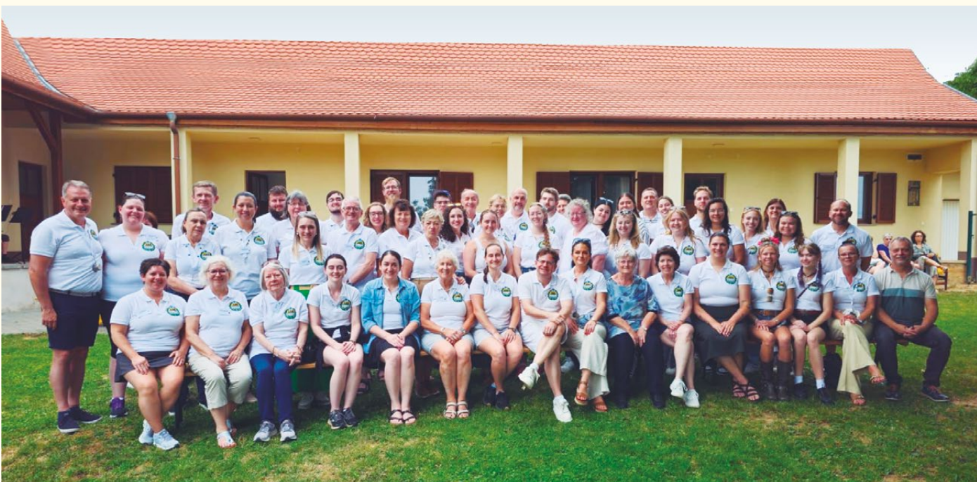
Visita do grupo em Geresdlak.